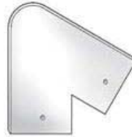
SCULPTURA SZ60 COVER STRIP CORNER SB1028