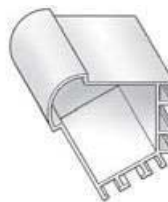
SCULPTURA 60 ML540