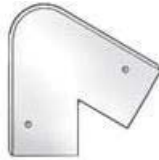
SCULPTURA 60 COVER STRIP CORNER SB1026