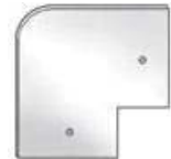
SCULPTURA SZ90 ADJACENT COVER STRIP CORNER SB1030