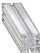
4-SLOT FRAME ML1008