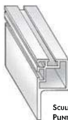
SCULPTURA PLINTH ML544